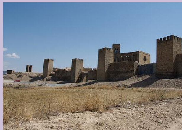
Artajona, en Navarra