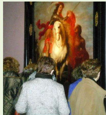
Socios de Landázuri admiran la obra.

Asimismo, los asistentes a esta charla tuvieron la oportunidad de ver el retablo de Olano, una obra de pintura gótica recién instalada en el museo, y la cual ha tardado quince largos años en ser restaurada.